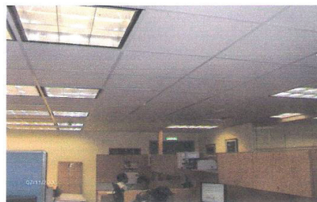
Figura 4. Distribución irregular de luminarias. Edificio La Campiña.

La distribución de luminarias fue irregular en las áreas donde estas son comunes a múltiples puestos de trabajo los cuales se ubicaron de esta forma según la Gerencia de Seguridad de la compañía. Ver Figura 4.