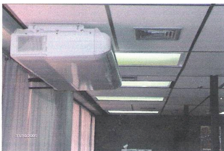
Figura 5. Luminaria obstaculizada por unidad de aire acondicionado. Edificio Sede de Maturín.

El total de luminarias instaladas en las oficinas evaluadas fue de 1.495, de las cuales 260 están defectuosas y 14 en mal funcionamiento, lo que representó el 17,39% y 5,38% respectivamente. En la figura 5 se muestran dos luminarias defectuosas.