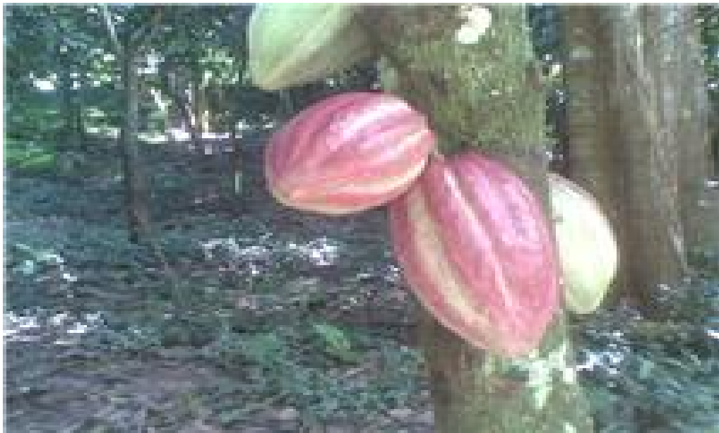
Maracas de cacao trinitario (materia prima para la elaboración del Chocolate).