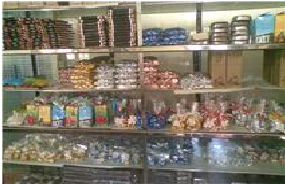
Gama de productos que elabora industrias alimenticias Bukare