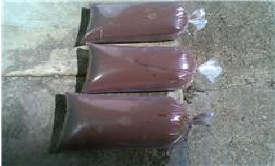
Licor de chocolate, utilizado para aplicarle formula