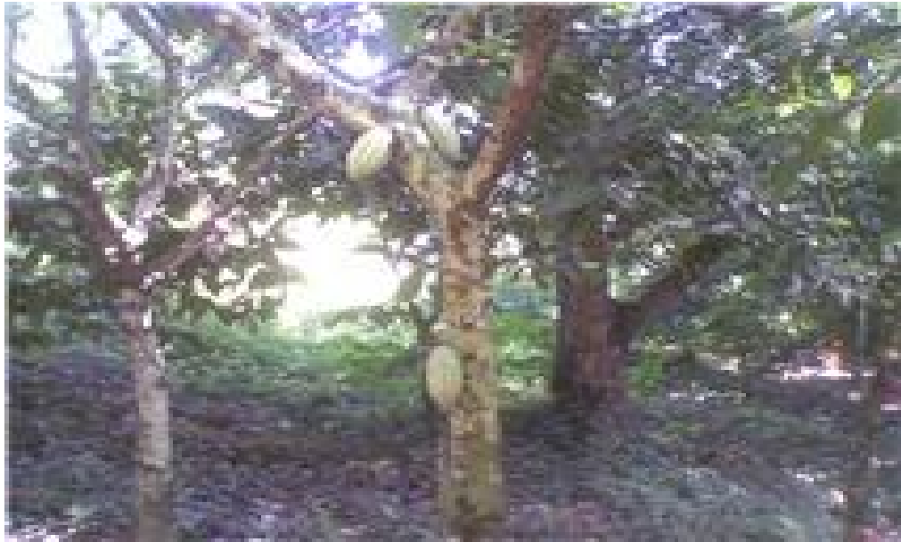
Plantación de cacao en la hacienda Bukare