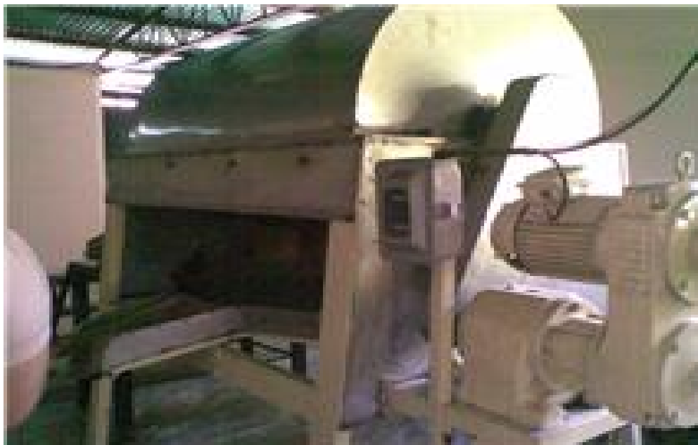
Tostadora industrial del grano de cacao