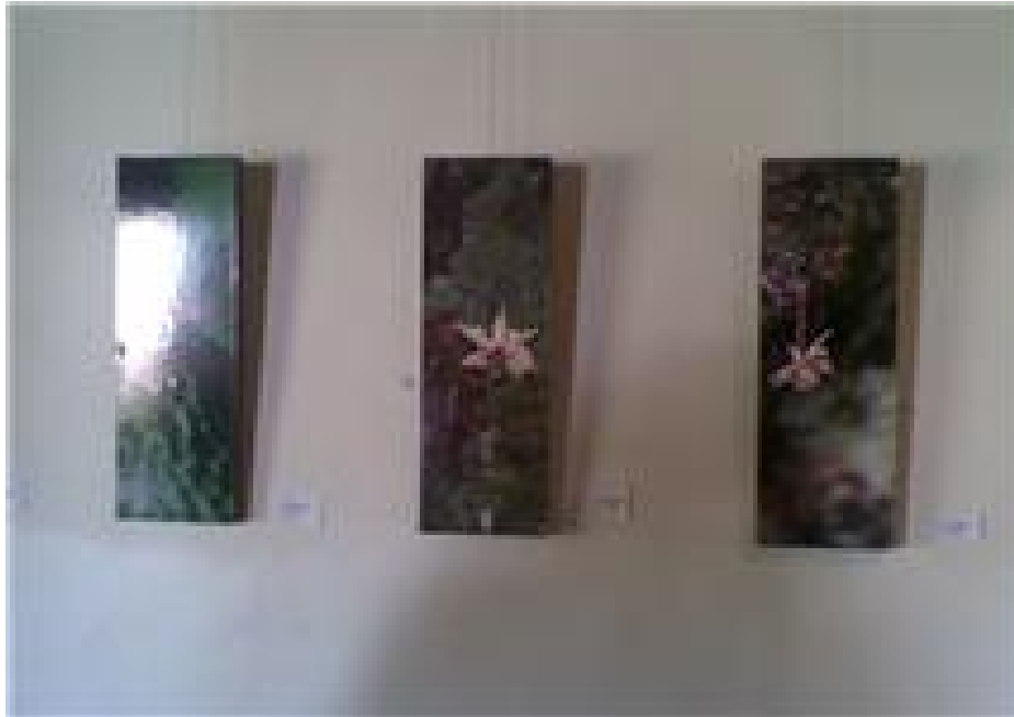
Algunas obras de arte dentro del museo Bukare