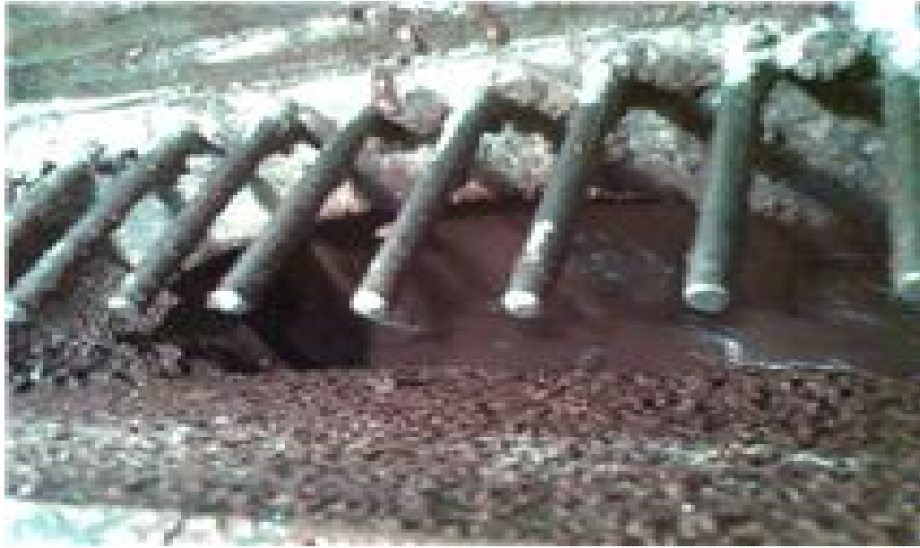
Licor de chocolate en la temperadora para el proceso