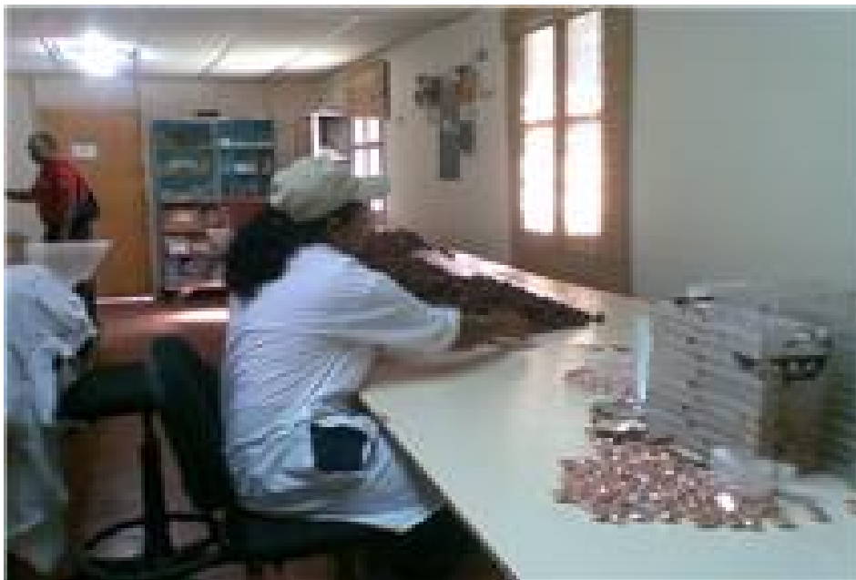
Mesa de empaque de productos terminado