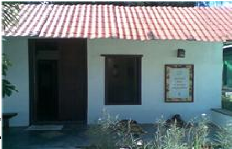
Museo del cacao