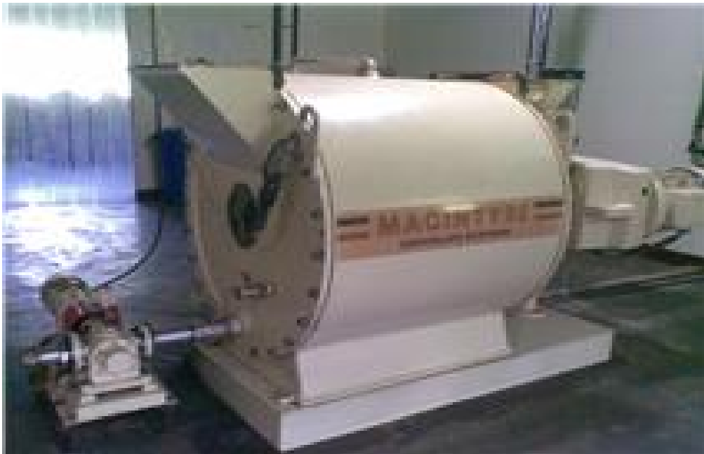
Temperadora, utilizada para darle consistencia a la pasta de chocolate