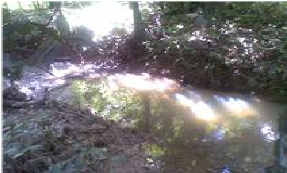
Quebrada que pasa por la plantación de cacao de la hacienda Bukare. Llamada “Quebrada seca”