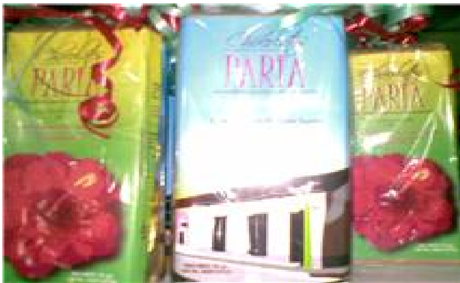
Chocolates paria sin