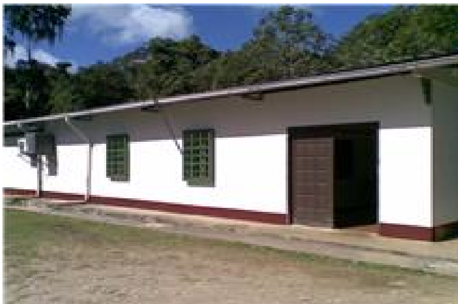
Infraestructura de la Industria Alimenticia Bukare