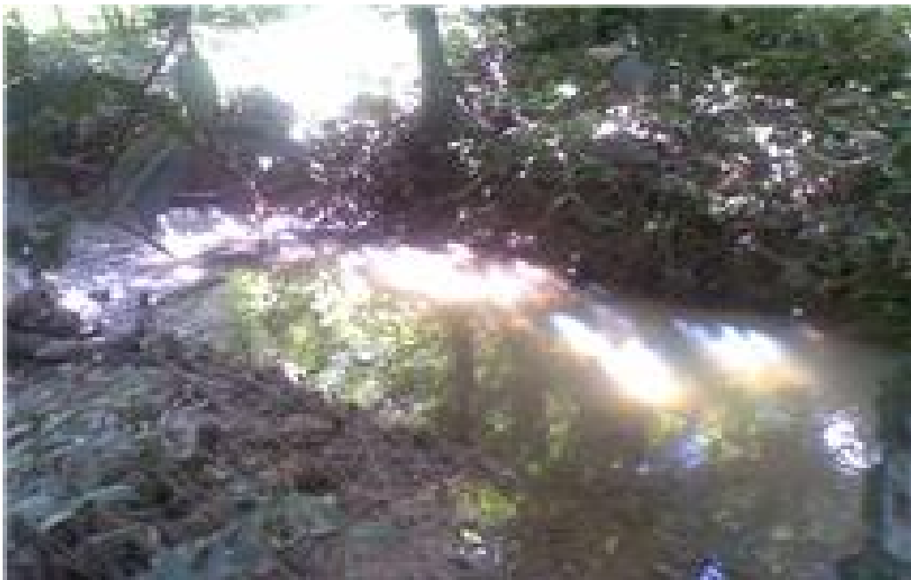
Quebrada que atraviesa la hacienda Bukare.