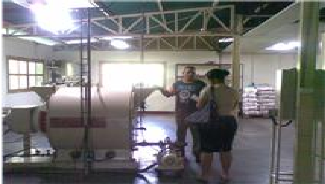
Trilladores del grano de cacao