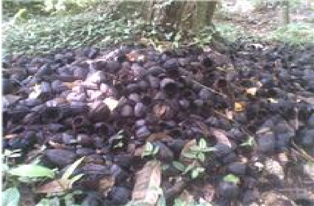
Desechos de materia prima, presente en la hacienda Bukare.