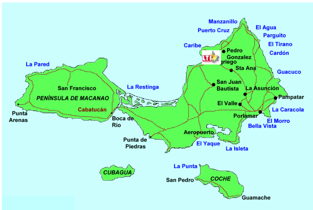
Figura 1. Ubicación de LTI Costa Caribe Beach Hotel