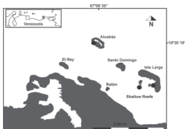
Fig. 1 Ubicación del Parque Nacional San Esteban demostrando las diferentes regiones muestreadas y los sitios arrecifales con presencia de parches de Acropora palmata identificadas durante el muestreo.

Métodos de Campo. Las colonias de A. palmata fueron identificadas en el año 2009 para su cuantificación y evaluación en los arrecifes de Isla Larga y Alcatraz;